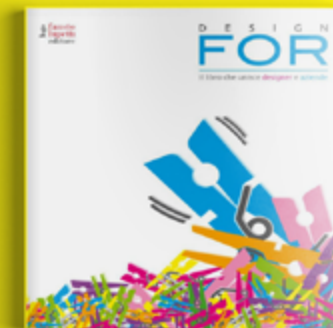
Design For 2012