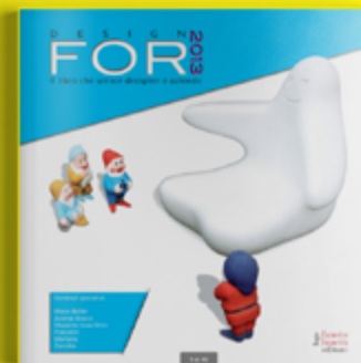
Design For 2013