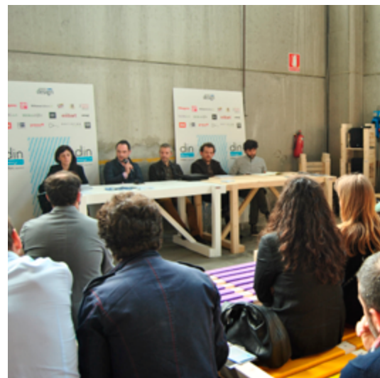
Design For 2014 11 aprile 2014 - Din 2014, zona Lambrate