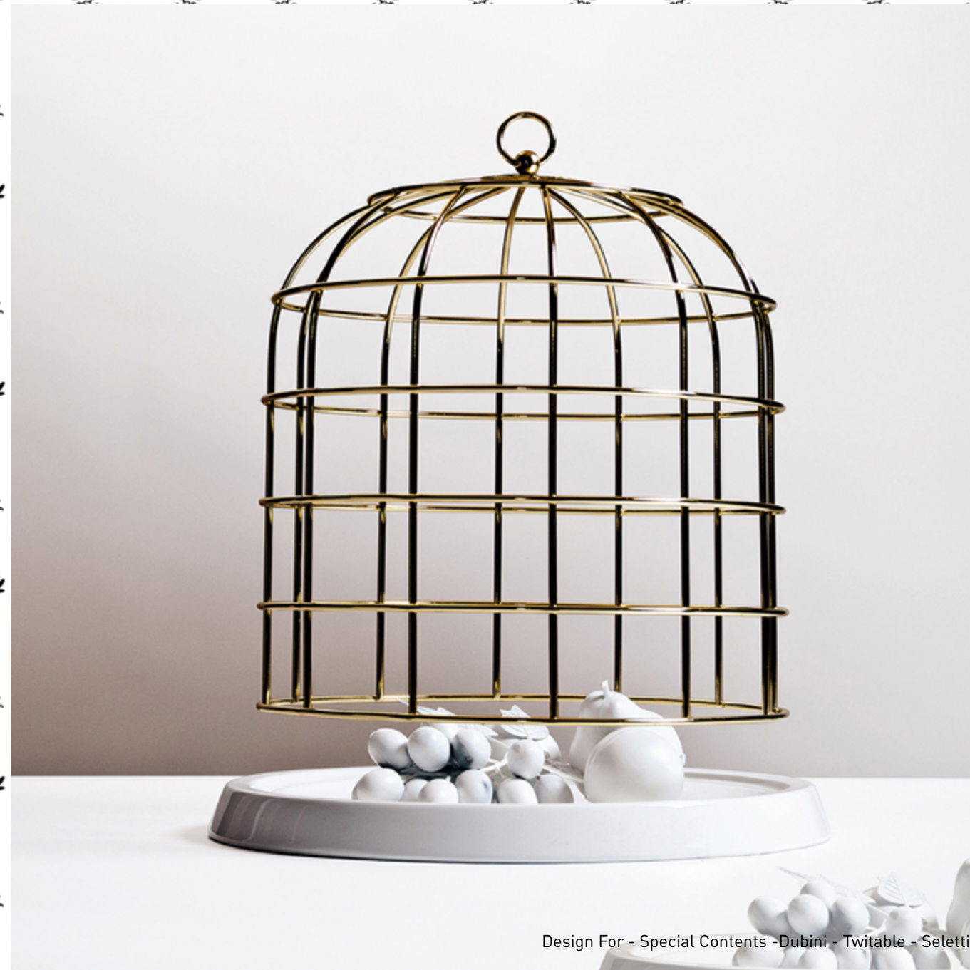
Design For - Special Contents - Dubini - Twitable - Seletti