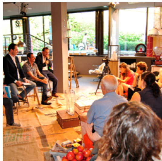
Design For 2013 7 settembre 2013 - S2 Style Concept Store, Como