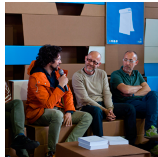
Design For 2015 18 aprile 2015 - Din 2015, zona Lambrate