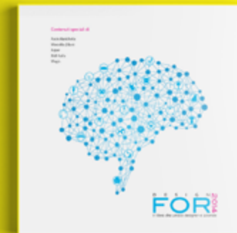
Design For 2014