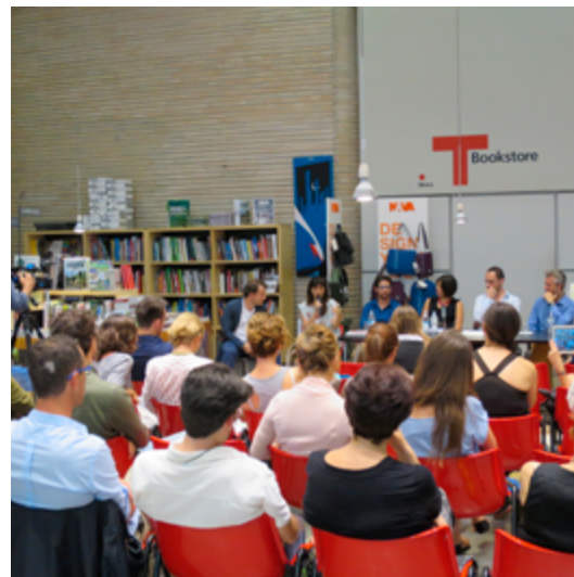
Design For 2014 17 luglio 2014 - Triennale di Milano