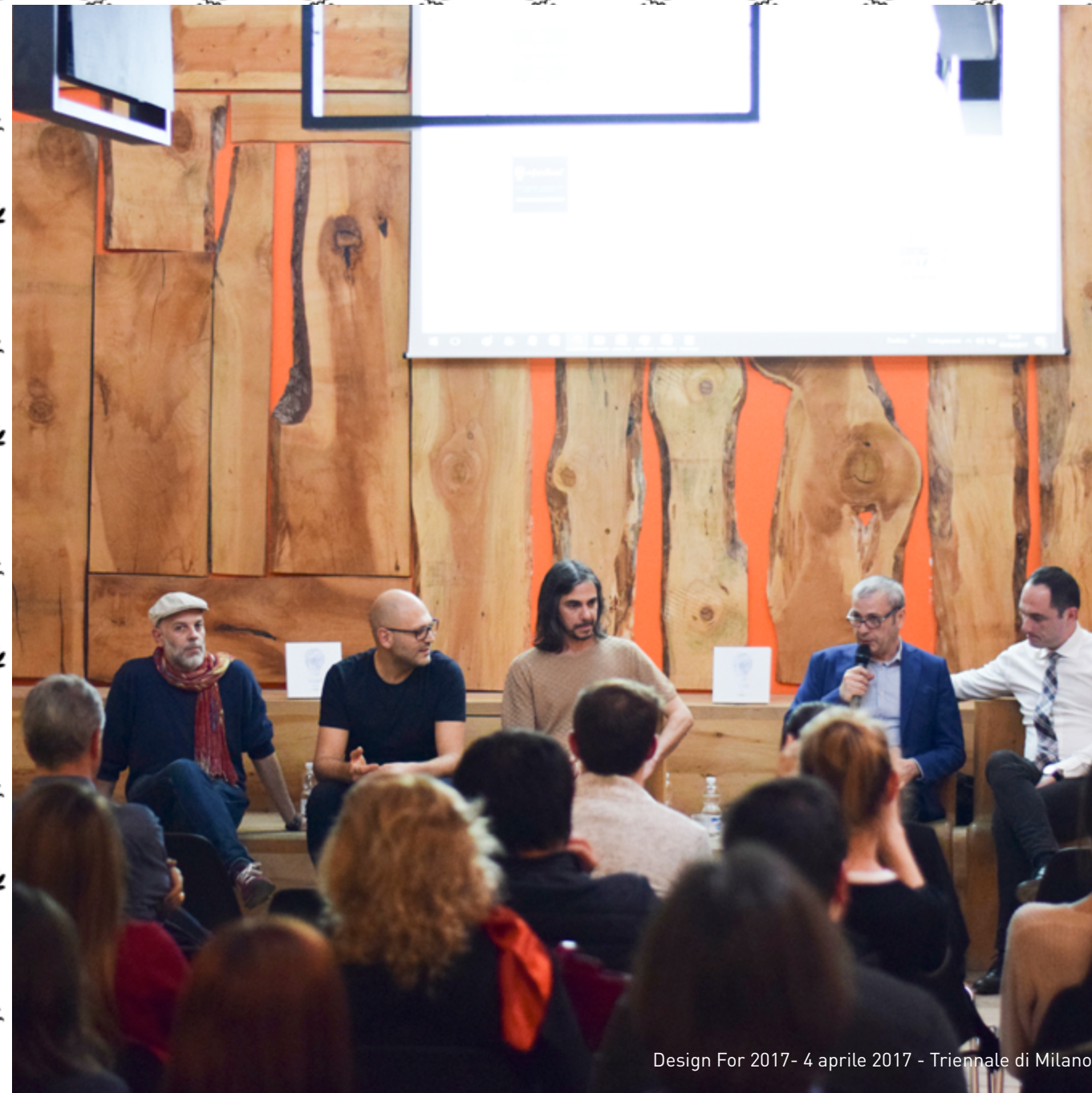
Design For 2017- 4 aprile 2017 - Triennale di Milano

Negli anni sono stati organizzati eventi durante la Design Week milanese presso la sede espositiva di Din Design In e presso la Triennale di Milano , inoltre sono state fatte varie presentazioni all'interno di alcune librerie.