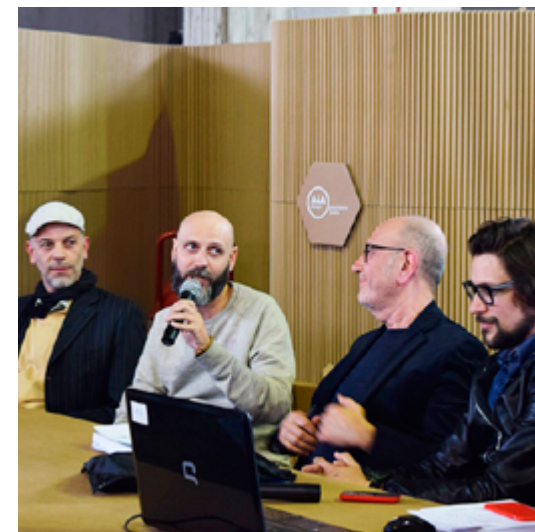
Design For 2016 16 aprile 2016 - Din 2016, zona Lambrate