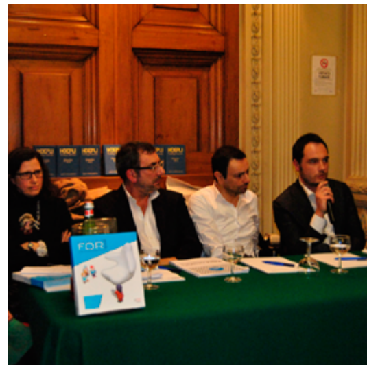
Design For 2013 11 aprile 2013 - Libreria Hoepli di Milano