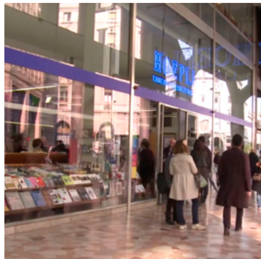
Design For 2012 20 aprile 2012 - Libreria Hoepli di Milano