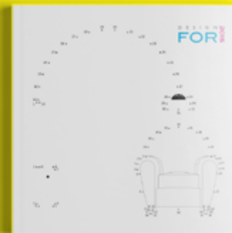
Design For 2015