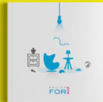
Design For 2016