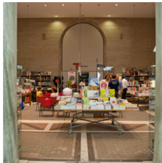
Design For 2015 16 luglio 2015 - Triennale di Milano