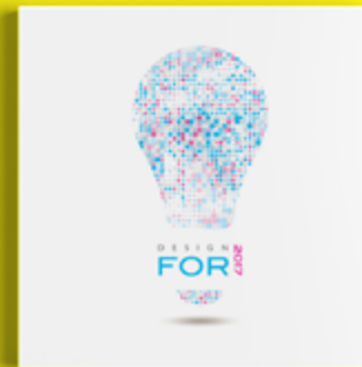
Design For 2017